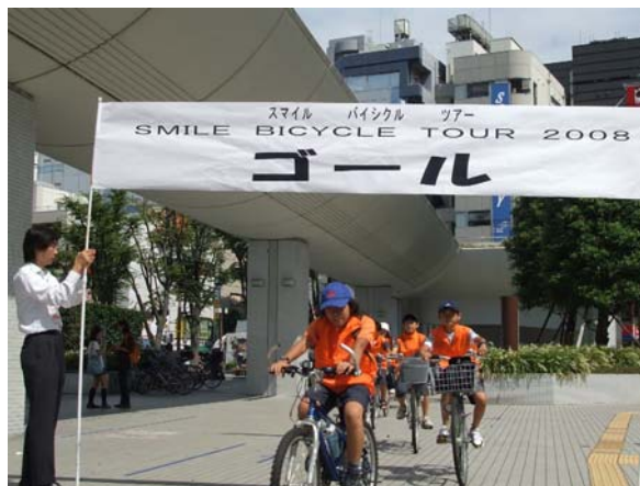
<スマイルバイシクルツアーのゴール>