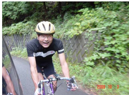
ヒルクライム(丸山林道にて)