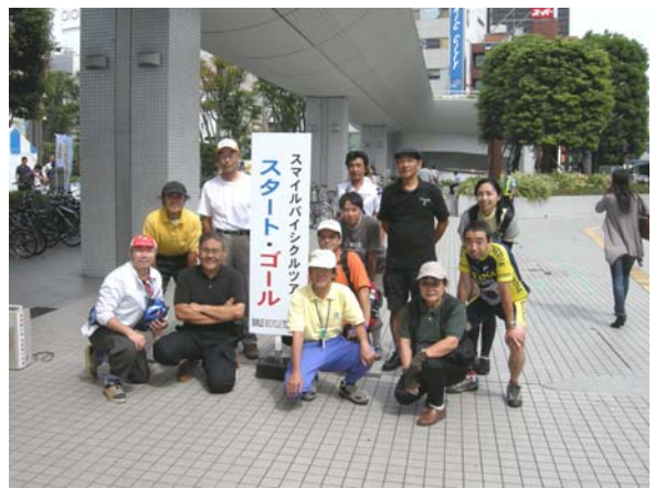
カーフリーデー(スマイルバイシクルツアー)