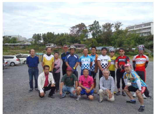
ヒルクライム大会：丸山林道