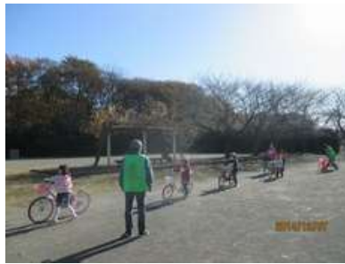
まずは自転車を押すことから