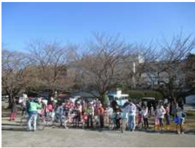
いよいよ練習開始

さいたま市レクリエーション協会・さいたま市サイクリング連盟主催の乗れない人の自転車教室が12月7日（日）、大宮体育館及びサブグラウンドで開催され、21人がトライしました。今回は21人中20人が子どもという異例の講習でした。閉講式では自転車交通ルールの講義も行いました。