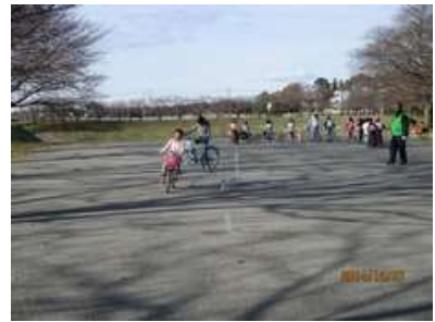
スラロームもできました