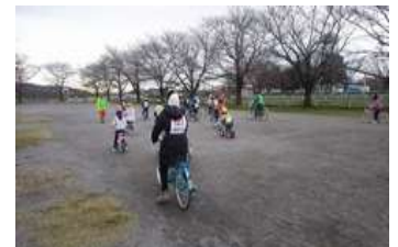
結構難しいですね!