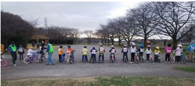
いよいよ練習開始

さいたま市レクリエーション協会・さいたま市サイクリング連盟主催の乗れない人の自転車教室が12月16日(日)、大宮体育館及びサブグラウンドで開催され20人が挑戦しました。