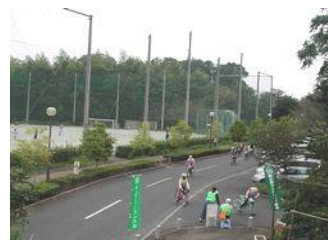
昨年の大会の様子