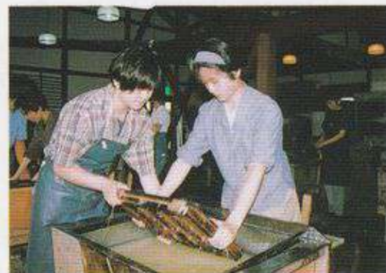
▲和紙の里（東秩父村）

インターナショナル・チャレンジ・サイクリング（ツール・ド・秩父）第4回大会までコースに使用されました。丸山林道はツール・ド・フランスの峠越えを思わせるかなり厳しい上りが続きます。県民の森付近では秩父市街地が見渡せ疲れをいやしてくれるでしょう。ここからは長い下りとなりますが、交通量も多いので対向車には十分注意しましょう。長瀬は対岸を走りますが、時折見える荒川の清流にみとれないように。