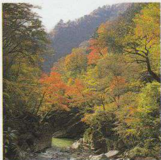
▲中津川溪谷（大滝村）

出合から八丁峠間は、採掘所がありトラックの通行が多く、また、危険箇所（発破作業場・トンネル等）もありますので、十分注意するとともに係員の指示等に従って走行ください。