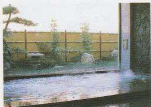
▲水と緑のふれあい館（皆野町）