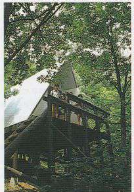
▲高原パーク横瀬 (横瀬町)