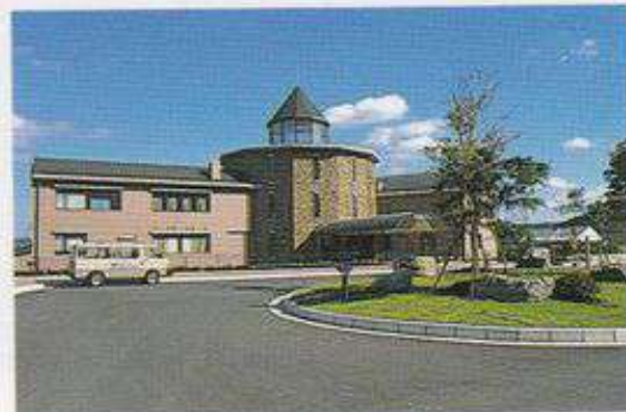
▲クアパレスおがの（小鹿野町）