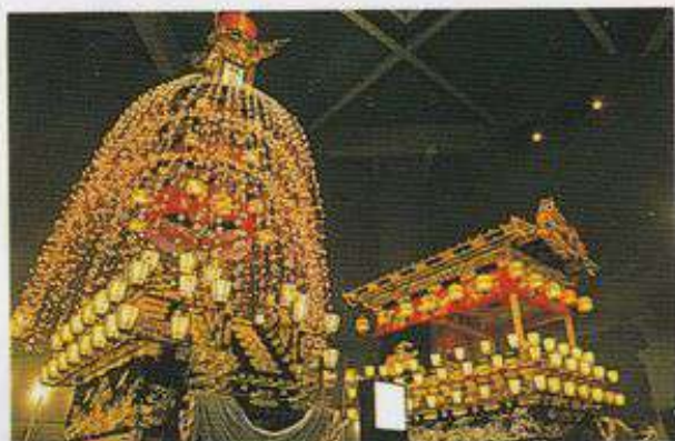
▲秩父まつり会館（秩父市）

市内には秩父の文化と歴史を物語る多くの名所・旧跡や札所が点在しています。 のんびりポタリングをしながら、秩父の人情と歴史にふれてみましょう。