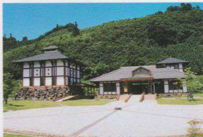
▲ 龍勢会館 (吉田町)