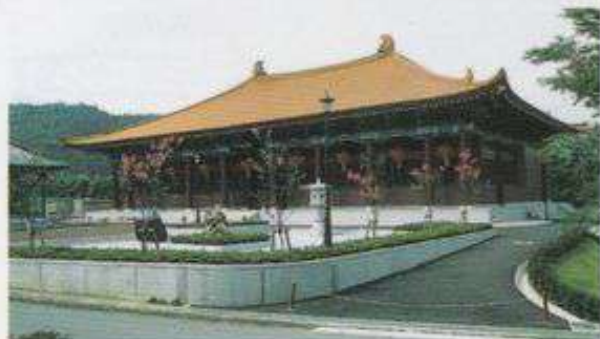
▲埼玉県山西省友好記念館（両神村）

インターナショナル・チャレンジ・サイクリング（ツール・ド・秩父）の常設コースです。田園情緒豊かで自然がまるごとのすばらしいコース、一部狭い場所やアップダウンが多少あります。途中には観光施設がたくさんありますが、ひと風呂浴びてもうひと頑張りしましょう。国道140号は車も多く特に秋は紅葉狩りの観光客が沢山きますので十分注意して走りましょう。